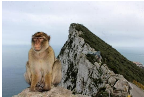
Peñón de Gibraltar

II. Lee el texto sobre los monos de Gibraltar y completa los espacios vacíos (de 1 a 7) con los fragmentos que faltan (de A a H). Puedes usar cada fragmento solo una vez. Hay un fragmento que no debes usar. _____ / 7