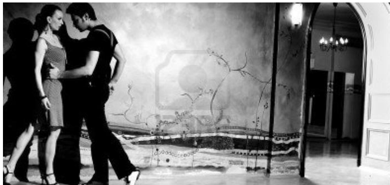
EL TANGO DE LA GUARDIA VIEJA

I. Lee el texto sobre tango y complétalo con una de las preposiciones que se te ofrecen. Rodea la opción correcta. ____ / 9